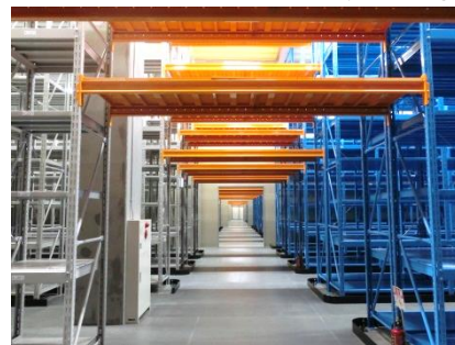
4Fアーカイブセンター内部